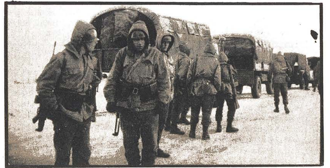
FIRTINA .I. TATBİKATI YADA BALYOZ HAREKATI DEĞİL TEPE MOBİLYADA GREV VARDI.

... Ondan sonra bunlar ne yaptı, bu bizim patronun ustabaşıları, her kim evinde tanıdığı var gittiler ona. Allettiler kalem ettiriler mesela "Bu grev kazanılmayacak, içeri sokmayacaklar, bize böyle böyle diyorlar filan, gel içeri gir işte size bu kadar zam var." Böyle teker teker herkesin evine gittiler, tanıdıklarının ya-